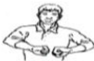
Ceinturer Retenir, Pousser