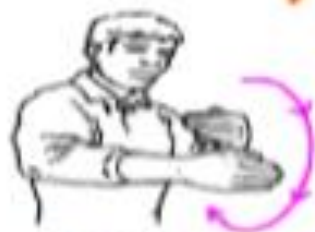
Marcher ou 3 secondes