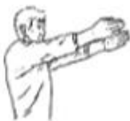
Remise en jeu (touche)