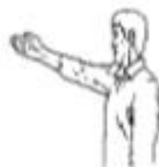
Jet Franc (direction) (sanctionne tout ce que je ne peux pas faire)