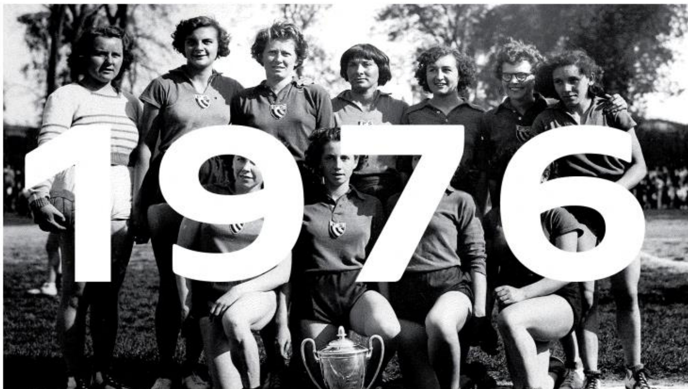
Entrée du handball féminin aux J.O. à Montréal.